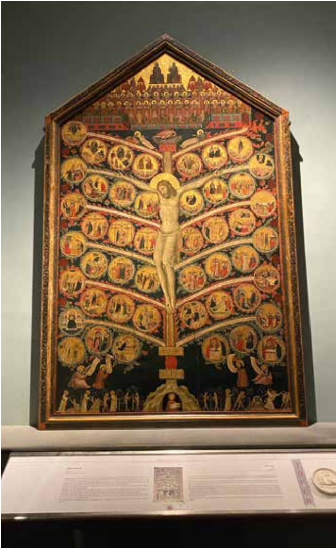
El Árbol de la Vida PACINO di BUONAGUIDA • 1305-1310 aprox.

El Árbol de la Vida, de Pacino di Buonaguida, es una pintura excepcional en técnica de temple sobre panel, realizada entre 1305 y 1310 para las monjas Clarisas del convento de Monticelli en Florencia. La crucifixión de Cristo se encuentra en el centro de la composición. El árbol simbólico y espiritual le da título a la obra, aludiendo al árbol de la vida mencionado en el libro del Apocalipsis; representa la esencia de la Salvación, produciendo doce cosechas al año, ofreciendo los dones de Dios a la humanidad.