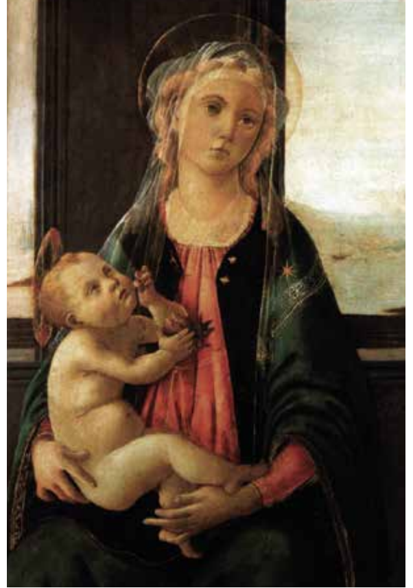
Sandro Botticelli (attr.) (1445-1510), Madonna with Child known as the Madonna of the Sea, 1475-1480

Alrededor de la estatua, en las paredes, se encuentran una serie de obras maestras del siglo XVI temprano, totalmente representativas del escenario cultural florentino de la época. En este mismo salón, los visitantes pueden observar una serie de asombrosas obras maestras, como el Cassone Adimari o la Madonna del Mar de Botticelli. El salón también presenta ejemplos de producciones cotidianas de algunos de los talleres más activos en la Florencia renacentista, como los liderados por Domenico Ghirlandaio o Cosimo Rosselli.