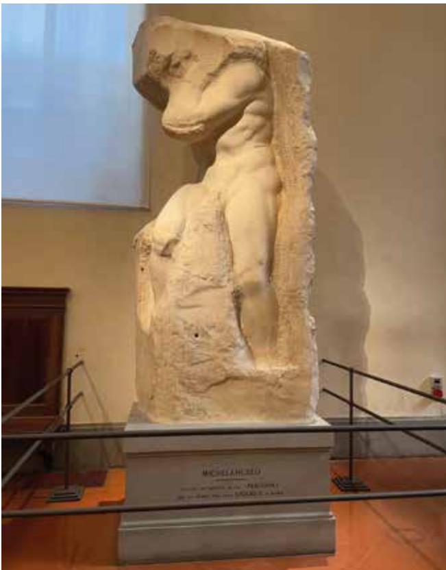
Michelangelo Buonarroti (1475-1564), Prigione known as Atlante (Atlas), ca. 1525-1530