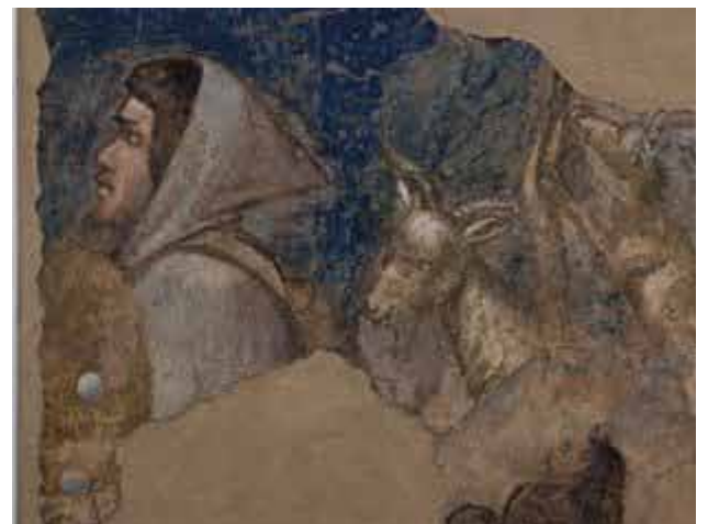
The Shepherd's Head GIOTTO di BONDONE • 1320 ca.