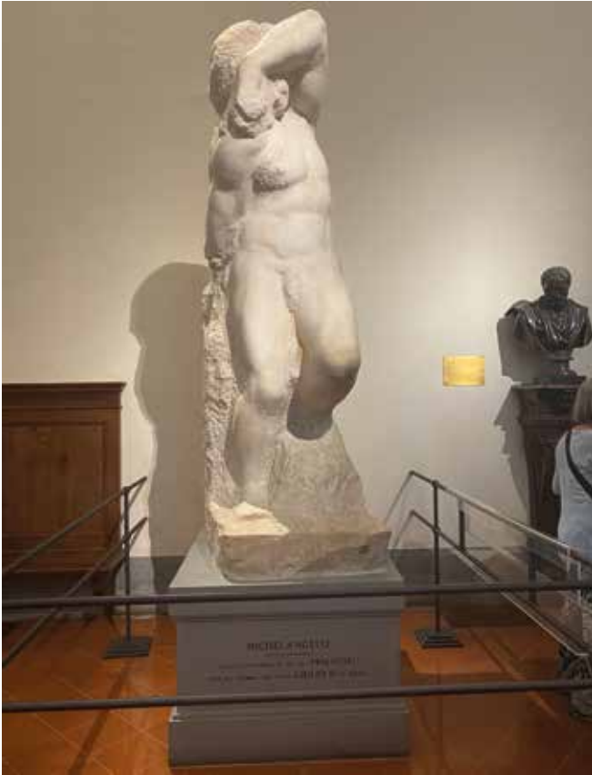
Michelangelo Buonarroti (1475-1564), Prigione known as lo Schiavo giovane (the Young Slave), ca. 1525-1530