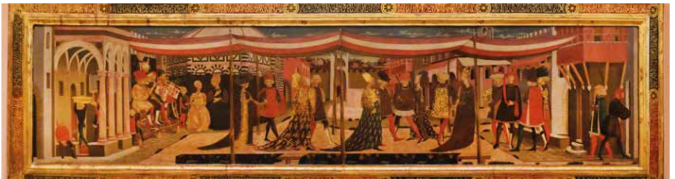
Giovanni di ser Giovanni Guidi (known as Lo Scheggia) (1406-1486), Cassone Adimari, ca. 1440-1450

Estas realidades eran talleres minuciosamente organizados donde los maestros trabajarían junto a grupos de colaboradores y discípulos para completar las numerosas comisiones de pintura destinadas a decorar los altares de las iglesias de la ciudad.