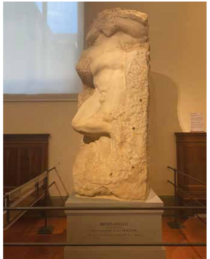
Michelangelo Buonarroti (1475-1564) Prigione known as Schiavo che si ridesta (the Awakening Slave), ca. 1525-1530