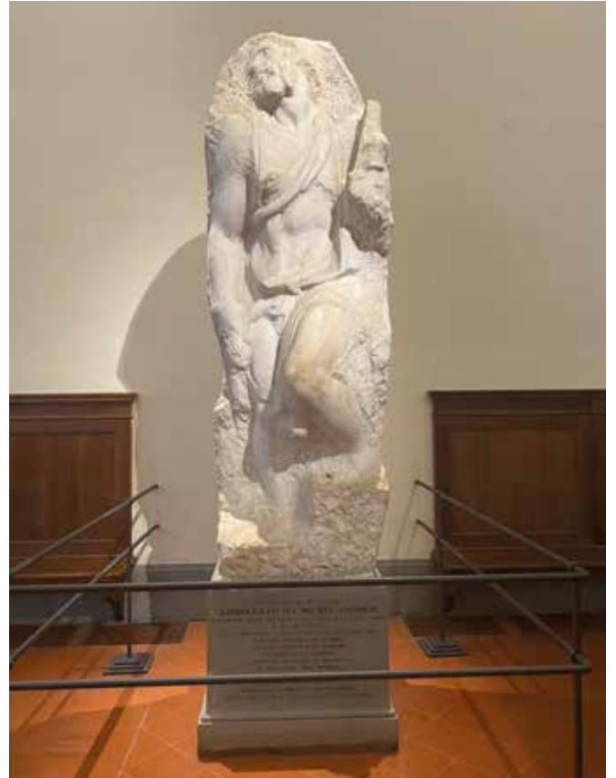
Michelangelo Buonarroti (1475-1564), St Matthew, 1505-1506