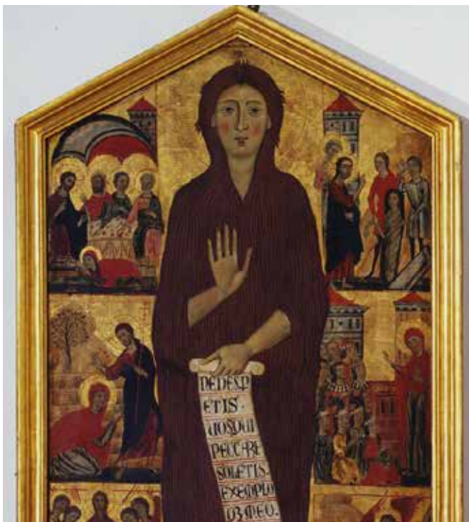
María Magdalena y ocho episodios de su vida, ca. 1280-1285

El Árbol de la Vida, de Pacino di Buonaguida, es una pintura excepcional en técnica de temple sobre panel, realizada entre 1305 y 1310 para las monjas Clarisas del convento de Monticelli en Florencia. La crucifixión de Cristo se encuentra en el centro de la composición. El árbol simbólico y espiritual le da título a la obra, aludiendo al árbol de la vida mencionado en el libro del Apocalipsis; representa la esencia de la Salvación, produciendo doce cosechas al año, ofreciendo los dones de Dios a la humanidad.