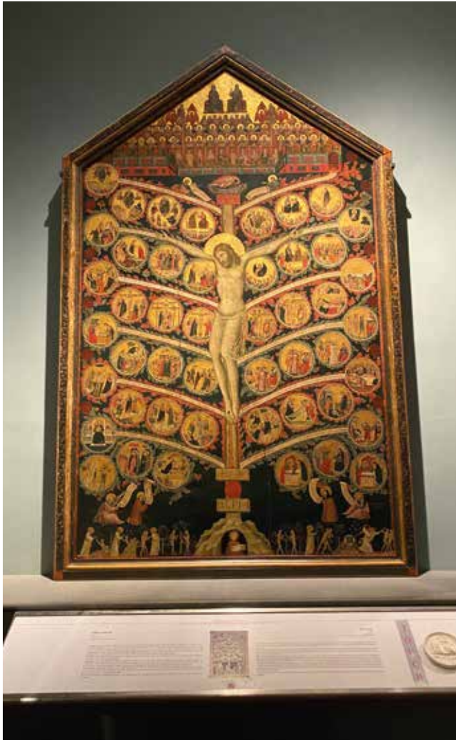
The Tree of Life PACINO di BUONAGUIDA • 1305-1310 ca.

L'Arbre de Vie, par Pacino di Buonaguida, est une peinture exceptionnelle réalisée en technique tempera sur panneau, exécutée entre 1305 et 1310 pour les religieuses Clarisses du couvent de Monticelli à Florence. Le Christ crucifié est au centre de la composition. L'arbre symbolique et spirituel donne son titre à l'œuvre, faisant allusion à l'arbre de vie mentionné dans le livre de l'Apocalypse ; il représente l'essence du Salut, produisant douze moissons par an, offrant les dons de Dieu à l'humanité.