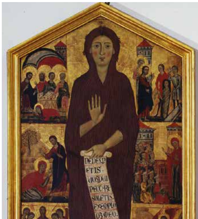
Magdalene and eight stories of her life, ca. 1280-1285

L'Arbre de Vie, par Pacino di Buonaguida, est une peinture exceptionnelle réalisée en technique tempera sur panneau, exécutée entre 1305 et 1310 pour les religieuses Clarisses du couvent de Monticelli à Florence. Le Christ crucifié est au centre de la composition. L'arbre symbolique et spirituel donne son titre à l'œuvre, faisant allusion à l'arbre de vie mentionné dans le livre de l'Apocalypse ; il représente l'essence du Salut, produisant douze moissons par an, offrant les dons de Dieu à l'humanité.