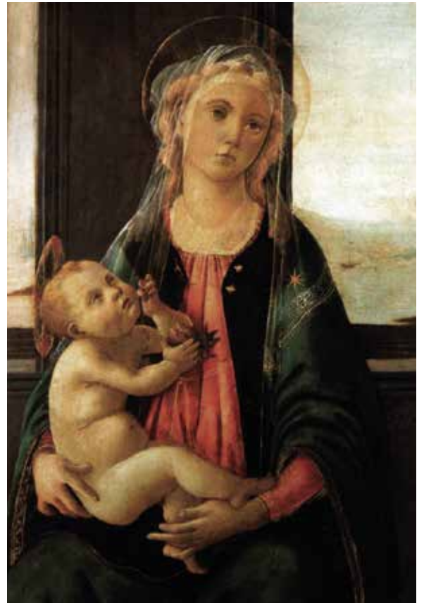
Sandro Botticelli (attr.) (1445-1510), Madonna with Child known as the Madonna of the Sea, 1475-1480

Autour de la statue, sur les murs, se trouve une série de chefs-d'œuvre du début du XVI e siècle, pleinement représentatifs du scénario culturel florentin de l'époque. Dans cette même salle, les visiteurs peuvent observer une série de chefs-d'œuvre stupéfiants, tels que le Cassone Adimari ou la Madonna della Loggia de Botticelli. La salle présente également des exemples de productions quotidiennes de certains des ateliers les plus actifs de la Florence de la Renaissance, tels que ceux dirigés par Domenico Ghirlandaio ou Cosimo Rosselli.