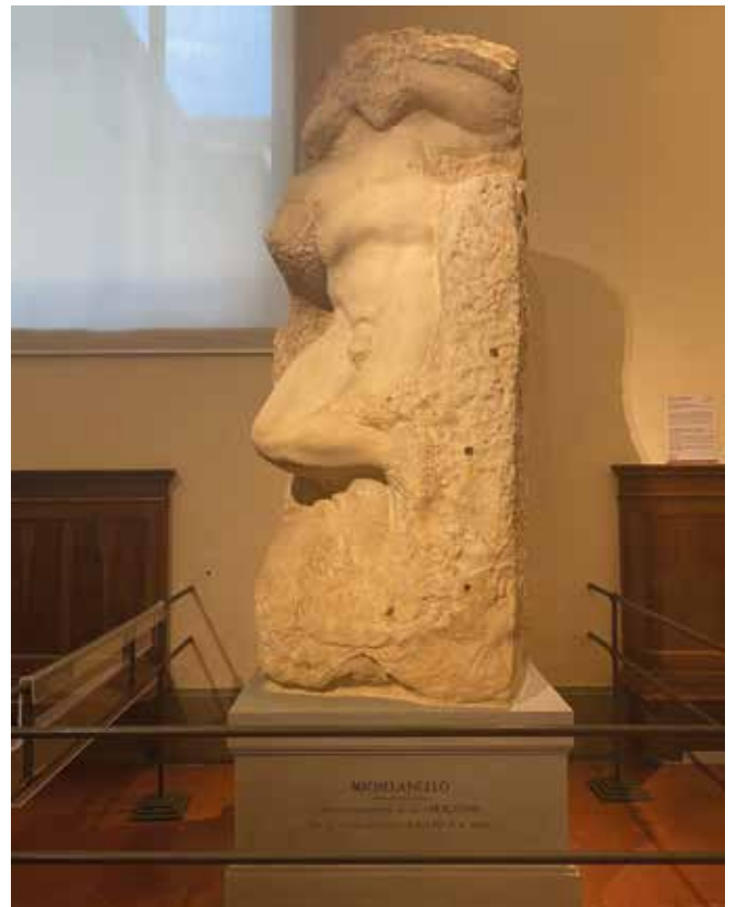
Michelangelo Buonarroti (1475-1564) Prigione known as Schiavo che si ridesta (the Awakening Slave), ca. 1525-1530