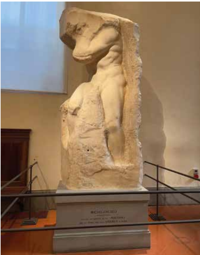
Michelangelo Buonarroti (1475-1564), Prigione known as Atlante (Atlas), ca. 1525-1530